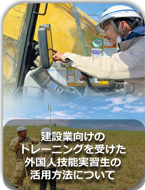
建設業向けの トレーニングを受けた 外国人技能実習生の 活用方法について