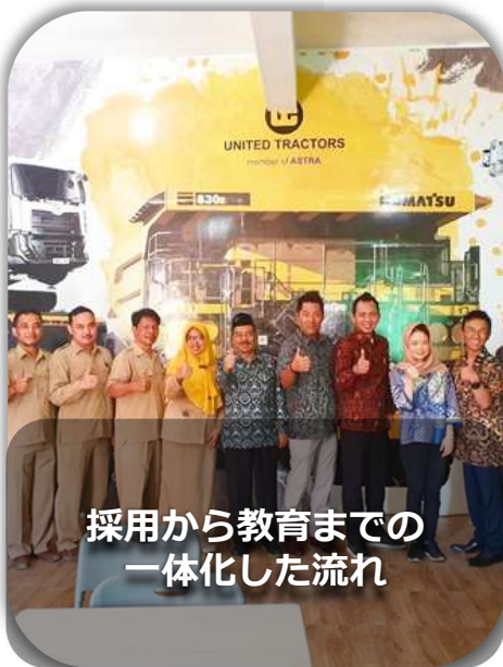
採用から教育までの 一体化した流れ