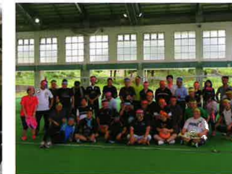
沖縄市総合運動場 多目的運動場

沖縄県法人会連合会 青年部会連絡協議会会員交流 【主管：沖縄中部法人会】平成30年9月7日 ~ソフトバレー大会~