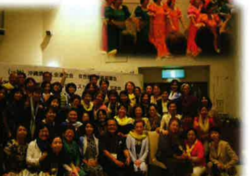
夕食交流会 【ホテルロイヤルマリンパレス石垣島】